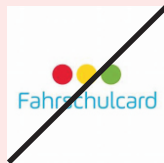
Freischaltung Euro 40,--