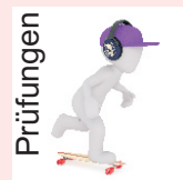
Prüfungen Treffpunkt: TÜV