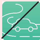
Freischaltung Euro 5,--