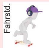
Fahrstd. Treffpunkt: Fahrschule