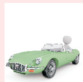
Fahrschule wählt Fahrlehrer!